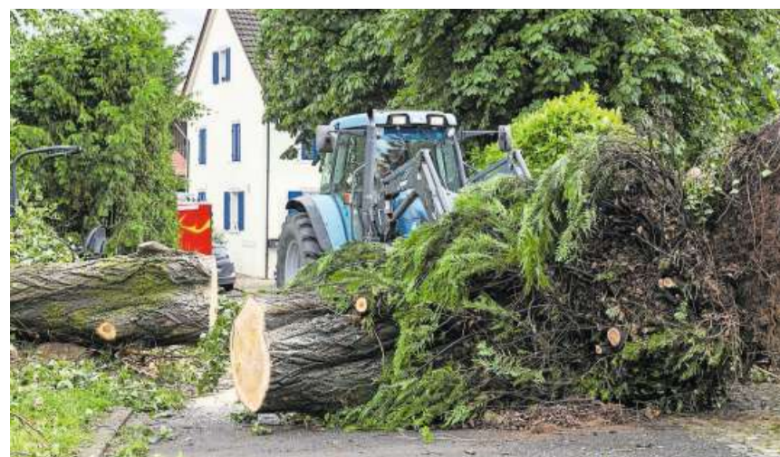
Einsatz mit schwerem Gerät: Die Feuerwehr Geissberg entfernte diesen umgestürzten Baum in Rüfenach noch am selben Tag.