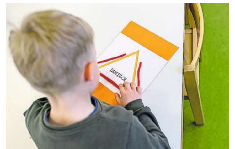
Der Kanton will die Sprachstanderhebung bei allen Kindern ein Jahr vor dem Eintritt in den Kindergarten einführen.

In den Pilotgemeinden übernimmt der Kanton für den Besuch einer Spielgruppe oder Kindertagesstätte die Betreuungskosten für zwei Halbtage à 2,5 Stunden, jedoch maximal 2600 Franken pro Kind für ein Schuljahr und bei Kindertagesstätten höchstens 50 Prozent der Betreuungskosten. Für die Berechnung der Förderkosten geht das BKS davon aus, dass bei ungefähr 80 Prozent der Kinder, deren Erstsprache nicht Deutsch ist, ein Förderbedarf festgestellt wird.