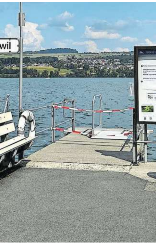
Der durch den Sturm beschädigte Steg Birrwil ist abgesperrt.