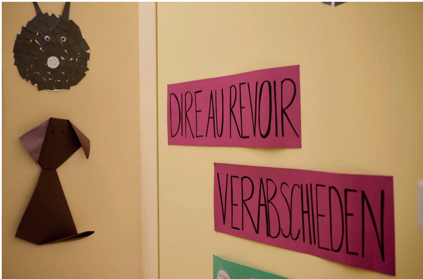
Zweisprachige Klassen: Was für die Primarschule Vignettaz richtig ist, muss nicht überall funktionieren.

Zudem verwies Ballmer auf die sehr unterschiedlichen Herausforderungen in den verschiedenen Quartierschulen. Zentral sind dabei die Kenntnisse, über welche die Kinder in jener Spra-