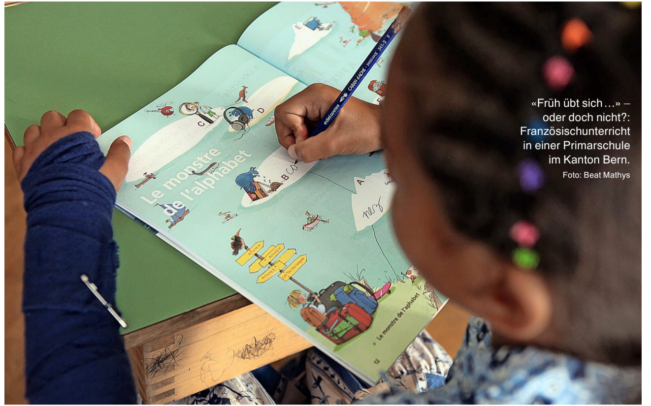
«Früh übt sich...» – oder doch nicht?: Französischunterricht in einer Primarschule im Kanton Bern.

Front gegen Primarschul-Französisch In 12 von 19 Deutschschweizer Kantonen ist die Abschaffung von Primarschul-Französisch ein Thema oder schon beschlossen. Der Bund könnte eingreifen. Warum wartet er zu?