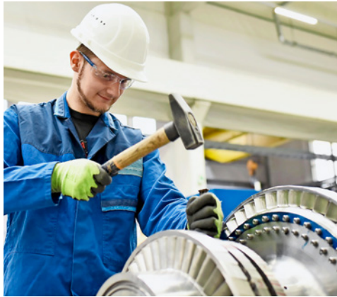
Bei der Berufswahl empfehlen Eltern ihren Söhnen eher männlich dominierte Berufe.

Eltern sind im Berufswahlprozess eine wichtige Unterstützung für Jugendliche. Eine Studie hat nun festgestellt, dass Mädchen bei der Wahl geschlechtsneutraler beraten werden als Jungs.