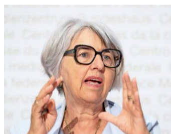
Fürs Frühfranzösisch: Bundesrätin Elisabeth Baume-Schneider.