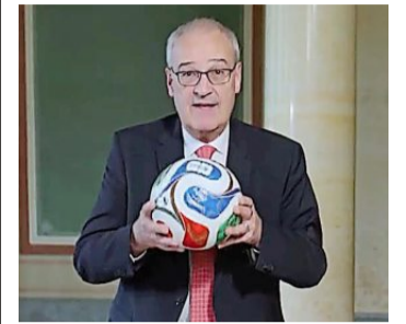
Guy Parmelin.

Bundespräsident Guy Parmelin und Sportminister Martin Pfister haben sich zur WM etwas einfallen lassen: In einem Instagram-Video dribbeln sie durchs Bundeshaus und wünschen der Nati, etwas hüftsteif, alles Gute. Der Spielaufbau erfolgt nach dem Kollegialitätsprinzip, technisch ist er ausbaufähig. Aber verglichen mit der Wohnproblematik und den Armeefinzen bewegt sich hier immerhin etwas.