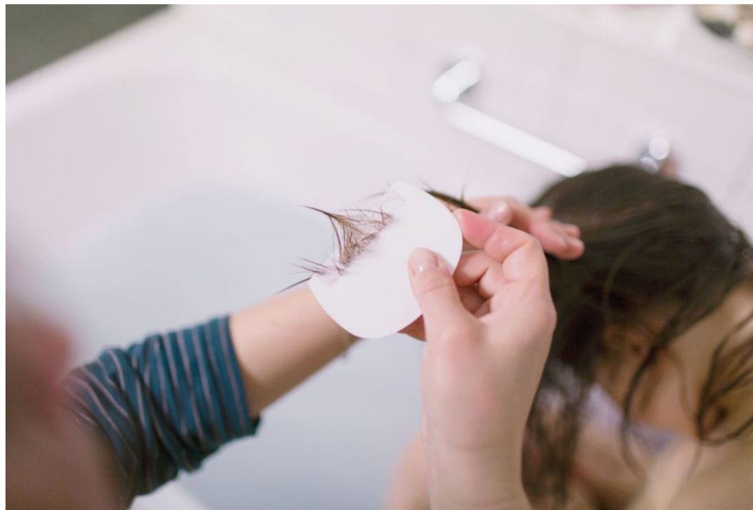
Bei Läusebefall müssen Eltern die Haare ihrer Kinder regelmässig kontrollieren (Symbolbild).