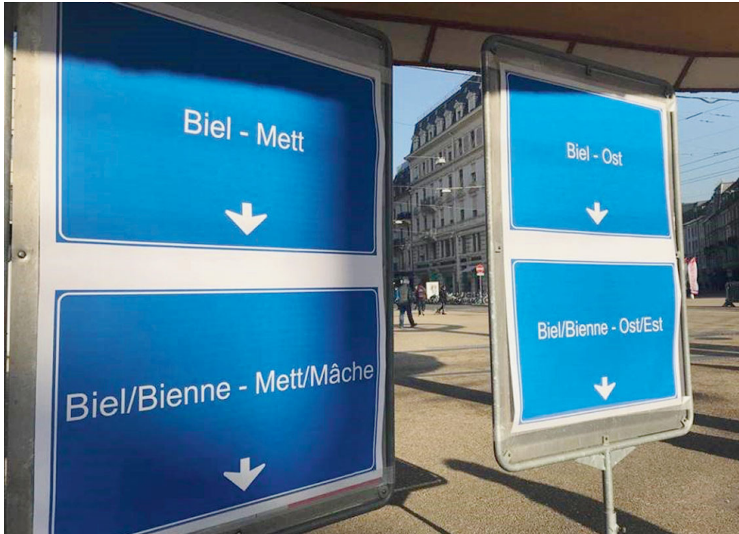
Les nouveaux panneaux de la branche Est devraient ressembler à ces exemples fictifs.

Les autorités biennoises, le Conseil des affaires francophones (CAF) et le Forum du bilin-