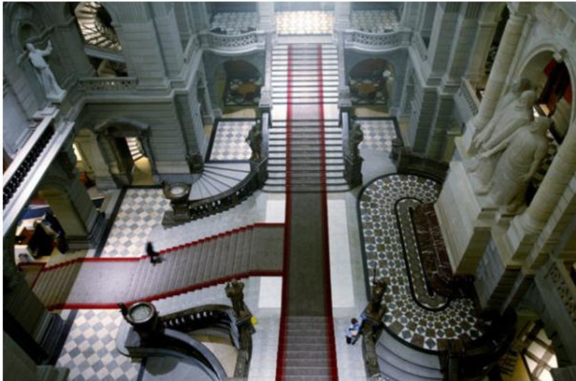
Au Parlement, les présidents des deux Chambres soutiennent le projet au même titre que le président de la Confédération.